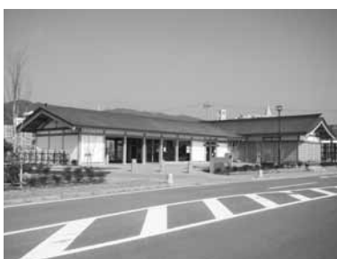
肥前国庁跡資料館