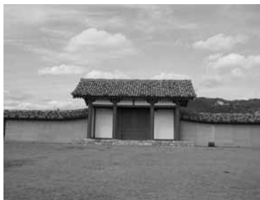
復元された南門と築地塀

問い合わせ 本庁 文化財課 文化財係 ☎40-7368 肥前国庁跡資料館 ☎62-7441