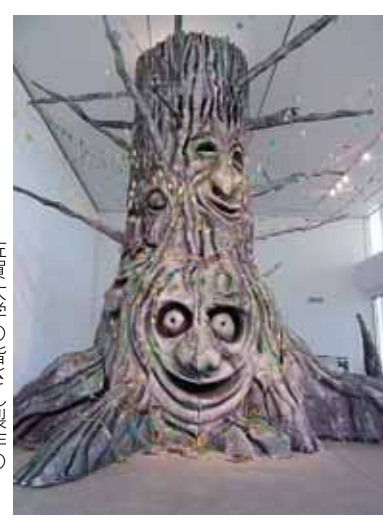
佐賀大学の皆さん製作の高さ5m以上の巨大ツリー!

※チケットは、文化会館ほか、市内のプレイガイドで販売中。入場整理券は文化会館、市役所、市立公民館等にありませす。 ○楽しいひなまつり (文化連盟川副支部 大詫間趣味の会) ・時間 20日(土) 10時～12時 21日(日) 13時30分～15時30分 ・参加料 800円(材料費) ※材料がなくなりしだい終了。