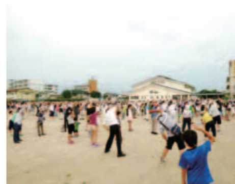
■日新校区(8月2日) なんと参加者1,000人以上! 日新まつりに向けて、日新首頭の練習もありました。