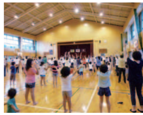
■久保泉校区(8月1日) ラジオ体操の後に、ご飯と味噌汁が振る舞われ、にぎやかな朝食となりました。