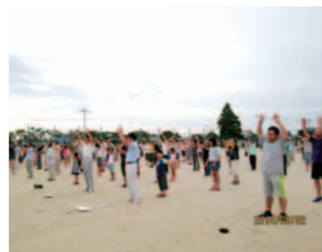
■中川副校区(8月2日) 博愛の里中川副まちづくり協議会の発足により、地域一丸となって行われました。