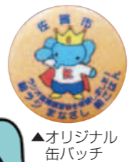
▲オリジナル缶バッジ