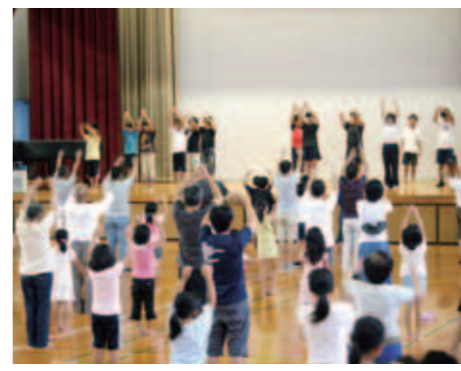
■川上校区(8月1日) 上級生がみんなのお手本です。あいにくの空模様でしたが、元気な笑顔がいっぱいでした。

※ほかにも多くの校区で開催されました。取り組みの様子は市ホームページに掲載しています。