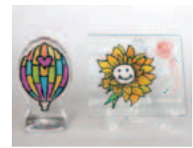
【ガラス絵付け体験イメージ】

佐賀市歴史民俗館・肥前通仙亭・恵比須DEまちづくりネットワーク・佐賀市観光協会・ユマニテさが協同イベント