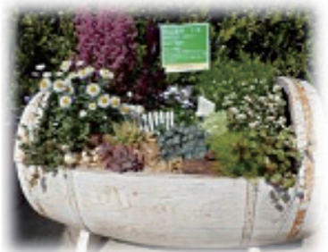
もみじ賞(優秀賞) 「お散歩びより」