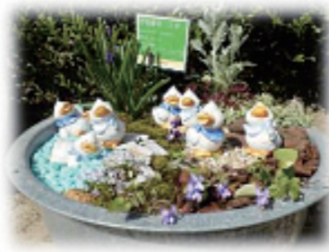
もみじ賞(優秀賞) 「ヒナたぼっこ」