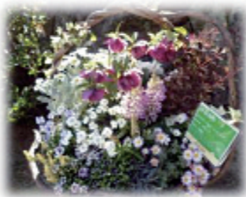
もりっぴー賞(最優秀作品) 「はーるよ来ーい♪」