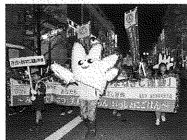
《まなざし君初登場》