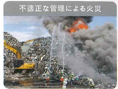
不適正な管理による火災

環境対策を行わずに廃家電を破壊 することで、フロンガスや鉛などの 有害物質が環境中に放出されます。