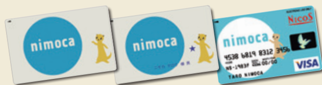
nimoca スター nimoca クレジット nimoca

※すべてのnimocaに西鉄バス・電車の定期券を搭載することができます。搭載できる定期券の種類についてはお問合せください。