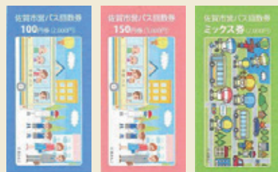
100円券 150円券 ミックス券