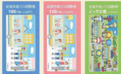
100円券 150円券 ミックス券