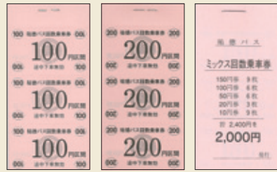
100円券 200円券 ミックス券