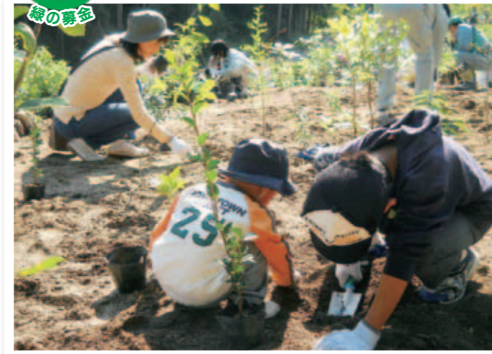
市民参加による嘉瀬川水源の森林づくり植樹祭(10月)

5月31日まで『緑の募金』春の運動期間を展開中です。 ご協力いただいた募金は、市民の皆さんの緑化活動の支援などに活用します。