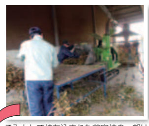
ごみとして持ち込まれた剪定枝の一部は

剪定枝チップの利用を始めて みませんか。 ※配布日時や場所は、佐賀市ホームページで確認ください。 ※在庫がない場合もありますので、 事前に問い合わせいただくと、 状況をお伝えできます。 ○堆肥の材料にも 米ぬかや元肥と混ぜ合わせると、良質の堆肥として利用できます。 ○クッション材・舗装材として 衝撃を緩め、やわらかい感触の舗装材としても利用できます。 ○マルチング材に 土壌に敷くと、雑草が生えにくく、土も乾燥しにくくなります。