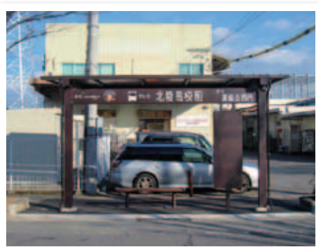
公営交通事業協会寄贈の北陵高校前バス停上屋

南部建設事務所 ☎45-1804 FAX45-8023 干潟よか公園管理棟 ☎・FAX45-5366