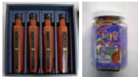
▲光樹とまとしずくシリーズ(光樹トマトジュース) ▲金柑コンフィチュール