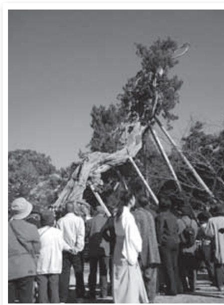
昨年のツアーの様子(諸富町新北神社のビャクシン)

佐賀には、市の保存樹や、名木・古木といわれる歴史のある緑がたくさんあります。バスツアーに参加して、歴史を感じる緑を体験してみませんか。樹木医さんの楽しい話も聞けます。