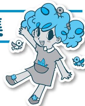
緑化推進課キャラクター もりっぴー

佐賀には、市の保存樹や、名木・古木といわれる歴史のある緑がたくさんあります。バスツアーに参加して、歴史を感じる緑を体験してみませんか。樹木医さんの楽しい話も聞けます。