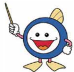
下水道協会 マスコットキャラクター スイスイくん