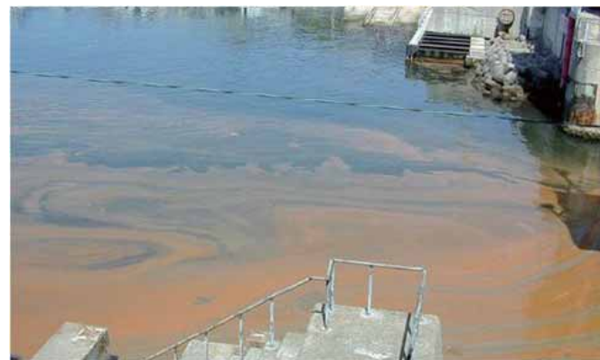
河川の汚濁により発生した「赤潮」の状況