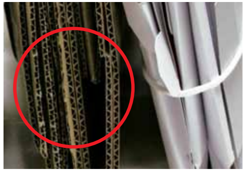
断面が波状のものが段ボールです