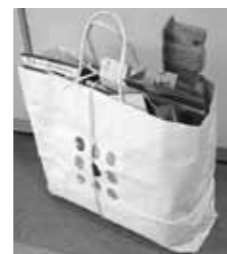
菓子箱などの紙製品は紙袋を使って出すことができます

○佐賀市で処理している燃えるごみには、リサイクルできる紙製品が多く含まれています。リサイクルできる紙製品は、燃えるごみではなく資源物として、回収にご協力ください。