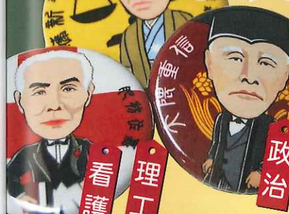
義祭同盟の地、楠神社(八幡神社内)の門前通り「県庁通り商店街」には賢人のほりがはためく

2010年11月の試験販売からわずか1年で8000個を売り上げる人気グッズ。一枚一枚が「学部別・専攻別」の受験や勉強のお守り代わりになっている! 価格: 1個100円 / 製造・販売・問合せ: 佐賀観光協会 / 電話: 0952-20-2200 / 販売所: JR佐賀駅観光案内所、有明佐賀空港売店(さがばいプラザ)、佐賀城本丸歴史館、大隈記念館、佐野常民記念館、肥前通仙亭、珈琲竹嶋など。 ※郵送も受け付けております。