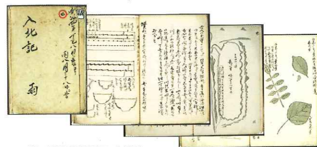
▲「入北記」(北海道大学付属図書館蔵) 島が2年間に渡る北海道探検の記録をまとめたもの。植物や生熊、アイヌの人々の生活の様子など、図入りで詳しく描かれている