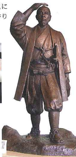
▶札幌市役所のロビーに立つ島義勇像