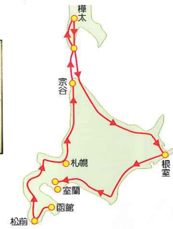
▲島が2年間で歩いた道程。現ロシア領の樺太にも渡っている。寒い夜は犬を抱き締めて暖をとったとのこと。大変な苦勞がしのばれる