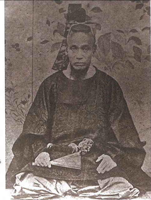
▲東帯姿の島義勇