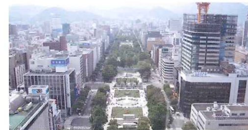
現在の札幌市の様子。島が極寒の寒さに耐えながら切り開いた荒地は多くの人々の生活と憩いの場となっている

【1889年(明治22年)賊名を解かれ、1916年(大正5年)従四位を贈られた】