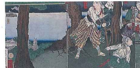
▲「佐賀県逆説」1877年刊(佐賀県立博物館蔵) 佐賀の役を描いた錦絵。島や江藤の姿も描かれている。

島は尊王攘夷の本場である水戸の学者、藤田東湖に思想的に傾倒しており、義祭同盟の志士たちの中でも特に過激な攘夷論者として知られていた。佐賀の役で江藤新平と一緒に戦ったのは思想的に近い同志というよりも、各々の事情で政府軍を共に迎え討ったというのが真相らしい。