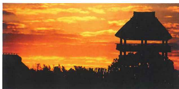
▲吉野ヶ里遺跡(神埼町)。その成り立ちには徐福も関わったと考えられる