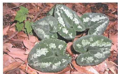
▲自生するフロフキ。徐福長寿館で実物を見る事ができる。同じ科のサイシシは実際に漢方薬として利用されている

仙薬を探る徐福が金立(きんりゅう)山で出会ったのは謎の仙人。徐福が仙薬の場所を訪ねると、仙人はゆがいている釜の中を見せ、霧のように消えてしまった。その釜の中にあったものこそ、徐福が求めてた仙薬で、「フロフキ」という葉草だった。フロフキは、今も自生しており、土地の人々は煎じて飲めば腹痛や頭痛に効果があると言う。