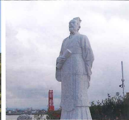
▲2011年11月、徐福が日本へ出航したという、中国の慈溪市から贈られた新たな徐福像。立つのは上陸地近くの「もろとみ一番館」前で、後ろに見えるのは筑後川昇開橋。実は左の写真の金立山前の徐福像とは視線が向かい合っており、片や上陸地、片や目的地の仙薬発見の地で、互いに日本で歩んだ旅路を見守っている