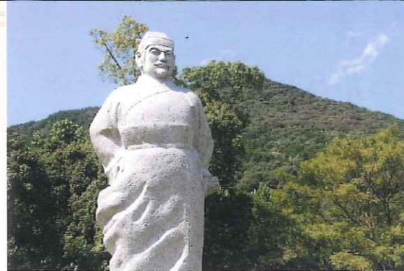
▲不老不死の仙薬をついに発見したのは金立山の山中だったと伝えられる。金立山を背景に立つ徐福の表情もなんとなくどや顔(笑)