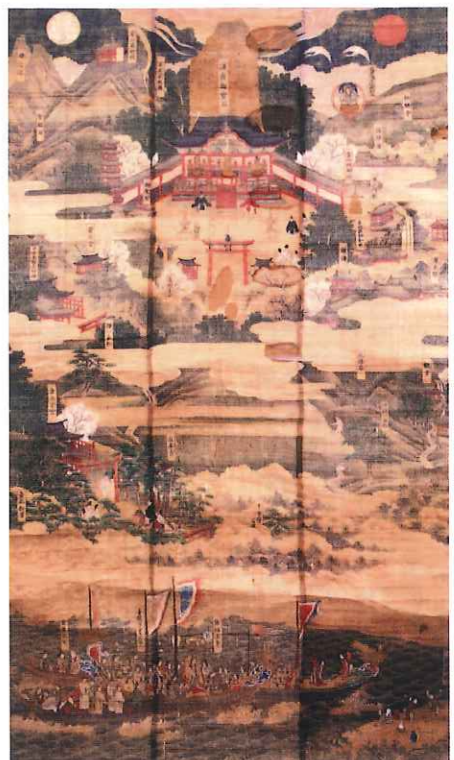
▲「金立神社園図縁起」(金立神社蔵 佐賀県立博物館寄託) 画面は絹布3枚継ぎで、上段は金立神社上宮、中段は金立神社下宮、下段は徐福上陸の場となっている。かつて天皇や鍋島家も参拝したという由緒ある金立神社の姿を伝える貴重な資料

佐賀でも何百年も前から、数々の徐福文化が脈々と受け継がれているが、本場中国では徐福は長い間伝説上の人物だった。しかし1981年、江蘇省において徐福が住んでいたと伝わる徐阜村(徐福村)が発見され、その存在が認められた。今、中国では、日中韓合同の徐福ドラマが企画されるなど、にわかに徐福ブームが巻き起こっている。