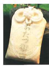
▲お辰観音堂の「おたつ御守」。恋愛成就にご利益あり

お辰は金立の地で徐福と恋仲になった娘。徐福が一時この地を離れる時、「5年後に戻る」との伝言があやまって「50年後」と伝わってしまったため、お辰は悲しみのあまり亡くなってしまった。これは中国、日本を含めて唯一伝わる徐福の悲しい恋の物語でもある。