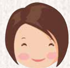
主任介護支援専門員

暮らしやすい地域づくりに取り組めます！ 公的機関、医療・福祉機関、地域の団体等のさまざまな機関と連携し、高齢者が安心して暮らせる地域づくりに努めます。