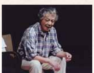
〔講演テーマ〕 あなたにもできるのです。 虐待予防支援が。