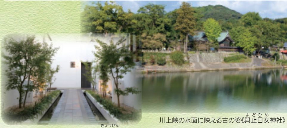
川上峡の水面に映える古の姿《 よどひめ 與止日女神社》

美しいまちづくりは、私たちの生活を豊かにするとともに、個性ある佐賀市の発展にも重要なものです。「佐賀市景観賞」は佐賀市民の景観やまちづくりに対する意識の向上を願い、これからの佐賀市の景観に対するひとつの道しるべとなるように、また市民の皆さんのまちづくりへの取り組みの一端を広く紹介できるように平成9年から実施しています。