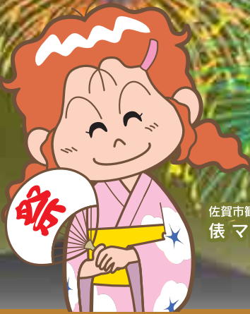
佐賀市観光キャラクター 係 マイちゃん