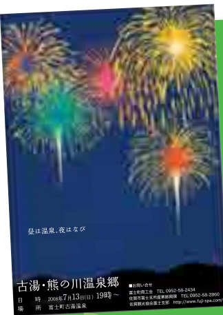
古湯・熊の川温泉郷 日時 2018年7月13日(日) 19時~ 場所 富士町古湯温泉