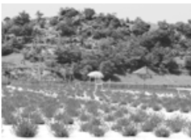
▲5月下旬にはラベンダー園がオープン!