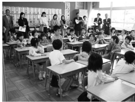
「教師と保育者の交流」