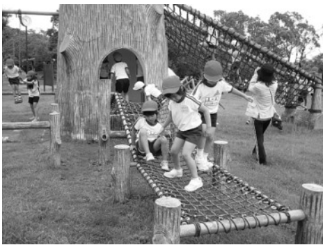
「幼児と児童の交流」