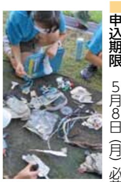
海洋プラごみの分析