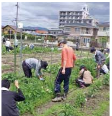
▲街なかで農業を体験しよう！