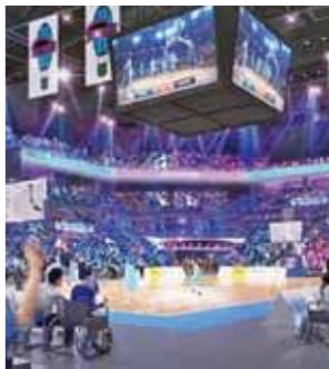
▲悲願のB1昇格と一緒に応援しましょう！