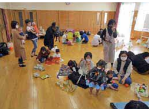
▲会場のあちこちで笑顔があふれました。