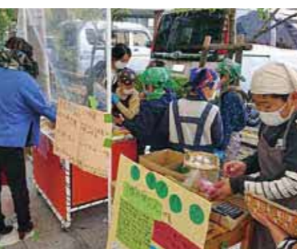
▲看板も目に付くように使う色を変えるなど、工夫しました。

キッズマーケットは、子どもたちにとって「商売のおもしろさ」を肌で感じ、「学び」「喜び」を育む大切な機会となりました。