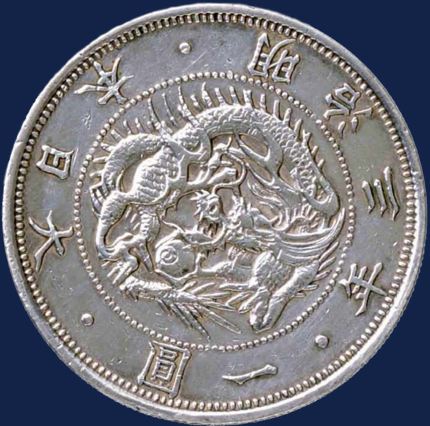
大日本一圓銀 明治3年 (大隈重信記念館蔵)