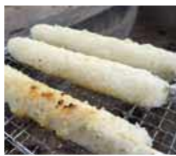
▲富士町で収穫されたお米で、きりたんぼ作り挑戦してみませんか?

日時 2月12日(土) 10時~12時30分 ※詳しくは、申込後に連絡 ■場所 さが21世紀民の森 総合案内センターほおのき ※現地集合・解散 ■定員 先着15人 ※小学生以下は保護者同伴 ■参加料 (体験料・保険料を含む) ・中学生以上 1500円 ・3歳以上 800円 ■持ってくるもの マスク・エプロン・タオル・三角巾・飲み物等 ■申込期限 2月8日(火) ※新型コロナウイルス感染症の状況等により、内容変更の場合あり。