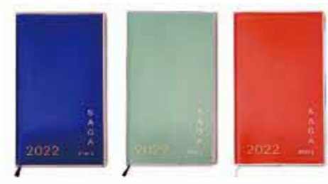
▲(左から)ネイビー、ミントブルー、コーラルレッドの3色

スケジュール表など通常の手帳の機能に加え、佐賀県の歳時記や統計データなど、郷土の情報が満載の手帳です。 ●価格 700円(税込) ●サイズ 横9・0cm×縦15・7cm ●取扱場所 本庁2階 総務法制課・各支所 市民サービスグループ ●取扱期間 令和4年1月末まで