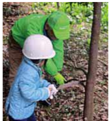
▲樹木の手入れについて学びながら、枝打ち体験や木工教室を行います。

■日時 12月11日(土) 10時～12時(少雨決行) ■場所 干潟よか公園 ■内容 樹木の枝打ち体験、木工教室(コースターづくり) ■参加料 無料 ■応募方法 氏名、電話番号、住所を明記の上、市ホームページ、ファクス、電子メールで応募ください。 ■申込期間 11月15日(月)～30日(火) ※先着50人程度。 ※参加者には、後日詳しい内容を連絡します。 詳しくはこちら▼