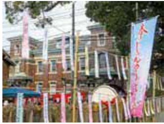
▲応募作品はすべて手作りの短冊にして柳町周辺に展示します。