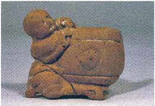
▲日本最古級小川遺跡出土土人形

これまで紹介されていない特筆すべき遺跡の紹介や、出土した貴重な遺物の展示を行います。 ■会場 肥前国庁跡資料館(入場無料) ■期間 11月23日(火・祝)～令和4年3月6日(日) 9時～16時30分(月曜休館)