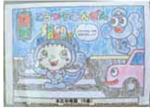
▲園児たちが作成した交通安全ぬり絵

交通事故の減少を願い、園児が作成したぬり絵を飲食店やショッピングモールなどに掲示しています。 ■掲示期間 掲示中～12月末ごろ ■掲示場所 佐賀市役所、佐賀南警察署、佐賀県飲食業生活同業組合佐賀支部加盟の飲食店、ショッピングモール等