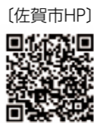
〔佐賀市HP〕 〔生産性向上 推進支援室〕