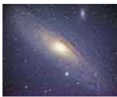
▲アンドロメダ銀河