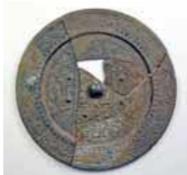
方格規矩鏡(七ヶ瀬遺跡出土)

○速報展(入場無料) 近年佐賀市域で発掘された遺跡の調査成果を紹介します。七ヶ瀬遺跡から出土した貴重な資料を初公開します。 ■場所 市立図書館中央ギャラリー ■期間 10月7日(木)～24日(日)