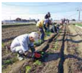
▲ジャガイモやホウレンソウ等の冬野菜を中心に、有機栽培技術を学びます。