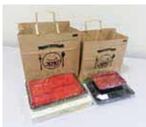
▲紙袋のサイズ（cm） 【小】高さ26×幅26×マチ16 【中】高さ29×幅30×マチ20