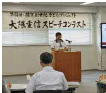
▲新しいことに挑戦したい・自分を成長させたい・リーダー性をのびたいという中学生を待っています！