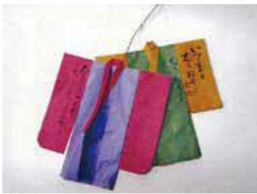
幕末の儒学者草場楓川の「婆心帖」に残る、佐賀の七夕紙衣を名尾和紙で作ってみませんか。