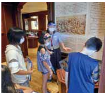
▲スピーチコンテストの予習や夏休みの自由研究として大隈重信について学ぼう