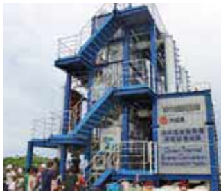
▲佐賀大学海洋温度差発電施設(久米島)

佐賀の偉人「第11代薩摩藩の功績や、お互いの歴史、自然等を学びながら交流します。」