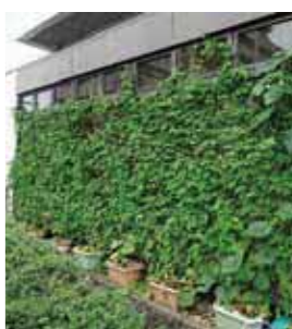
▲市内事業所の取り組み例

夏を涼しく過ごす工夫の一つとして、「緑のカーテン」を自宅や職場で作ってみませんか？直射日光を遮り、室内の温度上昇を抑え、リフレッシュ効果も期待できます。