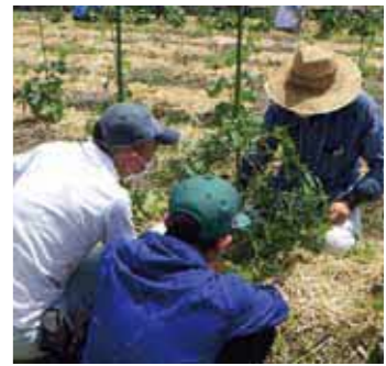
※キュウリ、ピーマン、ミニトマト、ナス、スイカ、オクラ等を予定。

対象 農園まで徒歩、自転車等で来園できる人(自家用車での来園不可) 日程 第1回 4月24日(土) ※以降、9月まで月1回2時間程度、参加者全員で作業を行います。 ※日々 の管理は各自(詳しくは別途通知) 場所 神野西4丁目 定員 20組程度 ※後日 、案内を郵送します。 参加料 1家族 3千円 指導 佐賀中央アグリビズ株式会社 申込方法 「街なか体験農園参加希望」と記入し、全員の郵便番号、住所、氏名、年齢、緊急連絡先(携帯番号)、メールアドレスまたはファクス番号を記入の上、はがき、ファクス、電子メールでご応募ください(電話申込不可)。 申込期限 4月20日(火) 必着