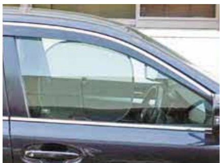
▲サンシェードを取り付けた状態

※取り締まりの詳しい内容等は、佐賀県警察本部または最寄りの警察署へお問い合わせください。