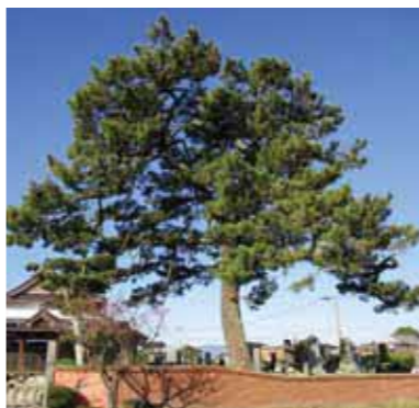
▲多間院のクロマツ