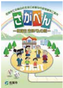
▲市民べんり帳の表紙

市役所の窓口や各種手続き、公共施設利用等の行政情報を1冊にまとめた市民べんり帳を市内全戸に配布します。