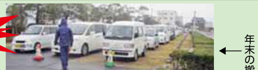
年末の搬入の様子

◎問い合わせ 循環型社会推進課(佐賀市清掃工場) ☎30・2430 FAX30・2494 ✉junkan@city.saga.lg.jp