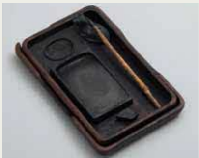
▲大隈侯が使用したとされる硯