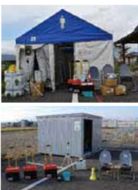
▲防災倉庫やトイレ基本セットなど、13点の防災用資機材を整備しました。

※宝くじ助成：宝くじの社会貢献広報事業として、宝くじの受託事業収入を財源として実施しているコミュニティ助成。