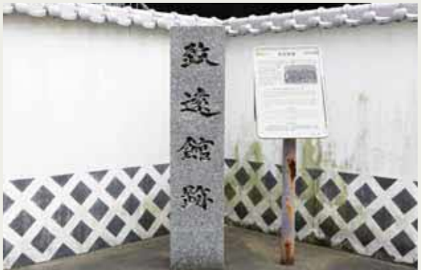
▲致遠館跡石碑（長崎県長崎市）