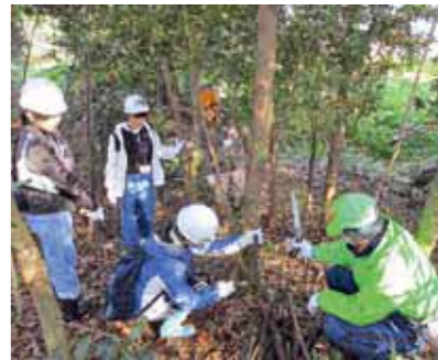
▲樹木の手入れについて学びながら、枝打ち体験を行います。

■日時 12月12日(土) 10時から2時間程度 ※少雨決行 ■場所 佐賀県緑化センター跡地 (高木瀬町東高木) ■内容 樹木の枝打ち体験、警察音楽隊によるミニコンサートなど ■参加料 無料 ■申込開始 11月16日(月) ※先着50人 ■申込方法 住所、氏名、電話番号を明記の上、ホームページ・ファクスまたは電子メールで申し込みください。 ホームページはこちら→