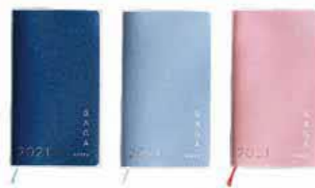
▲(左から)ネイビー、アイスブルー、ピンクの3色