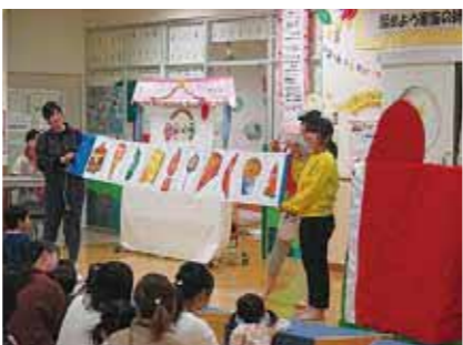
▲親子でステキな時間を過ごしましょう!