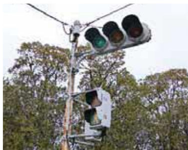
▲公募により、あらかじめ市が定めた予定価格以上の最高価格で売却します。