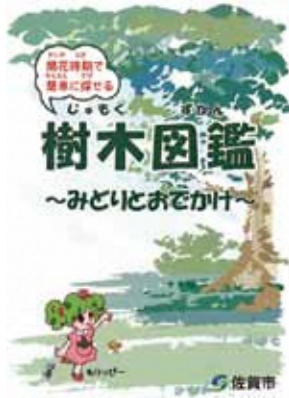
▲参加者にはミニサイズの樹木図鑑をプレゼント!