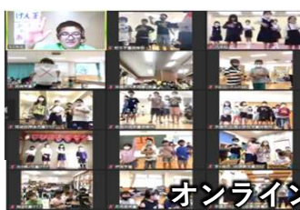
オンラインプログラム