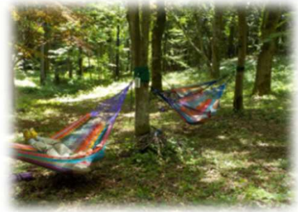
寝落ちする人続出！ 森の中でのハンモック体験