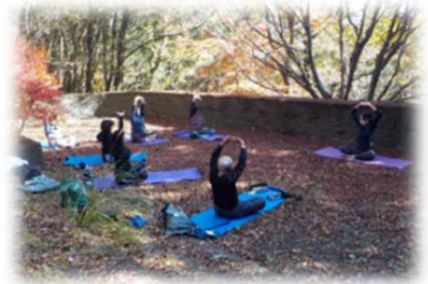
紅葉を見ながらのヨガ体験