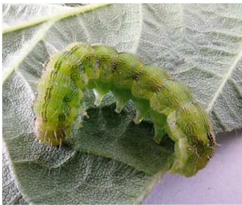
オオタバコガ幼虫