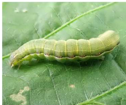
シロイチモジヨトウ幼虫