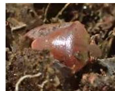
越冬中のチャバネ アオカメムシ

今年のチャバネアオカメムシの越冬量は平年より多いことから、本年の果樹園への飛来量は平年より多くなると予想されます。