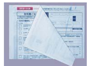
ノーカーボン (裏に色がついていない 複写用紙)