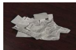
紙感熱紙 (レシート、FAX用紙)