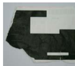
カーボン紙 (複写用紙で裏が 黒色や青色のもの)