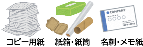
コピー用紙 紙箱・紙筒 名刺・メモ紙