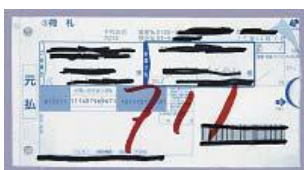
粘着紙 (複写伝票や圧着はがき)