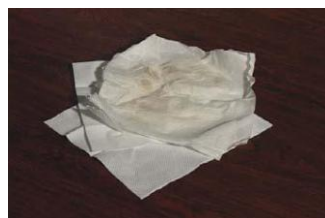
汚れた紙 (油や食品残さが付着した紙)