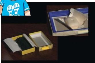
においのついた紙 (線香や洗剤の箱)