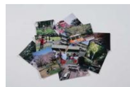
インクジェット紙 (写真など)