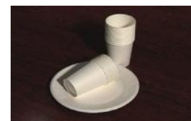
防水加工された紙 (紙コップなど)