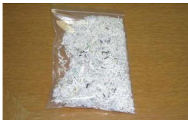
シュレッダー紙 (名刺サイズより 小さい紙)