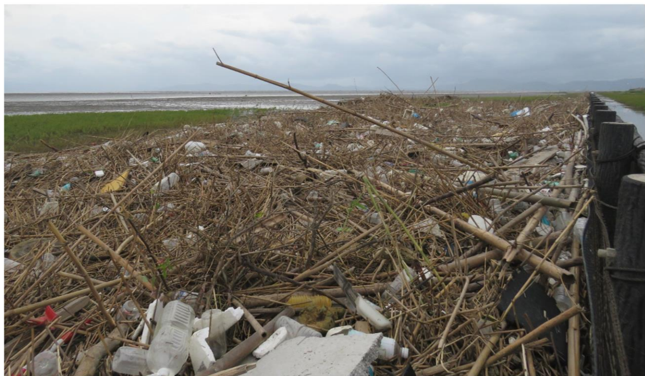
東与賀海岸に漂着したごみ(令和3年8月)