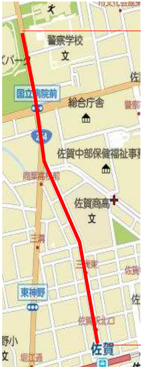
愛称設定区間 佐賀駅北口交差点 ～サンライズパーク交差点