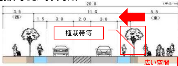
植樹帯等の位置変更(歩道中央→車道側へ)

・拡幅する東側の歩道空間を広く活用できるように植栽帯などの位置を道路側に移動して整備することになりました。