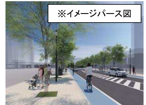
※イメージパース図