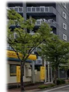
街路樹は既存樹(ケヤキ)を植樹