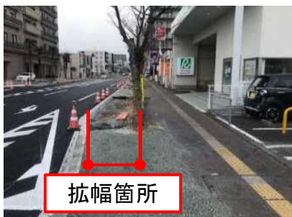
▲東側歩道(拡幅状況)