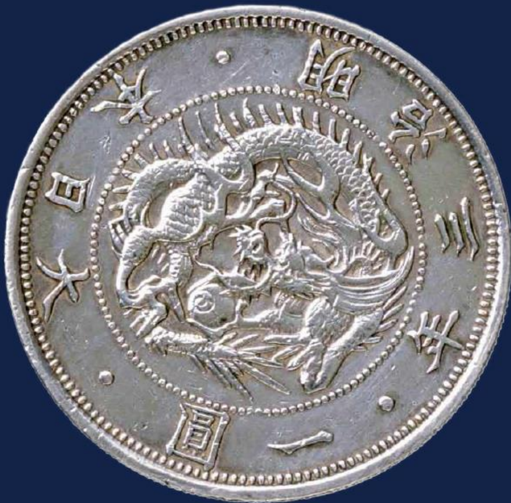
大日本一圓銀 明治3年 (大隈重信記念館蔵)