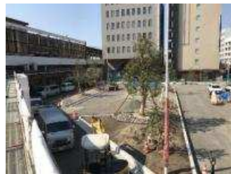
▲クスノキなど（常緑樹）