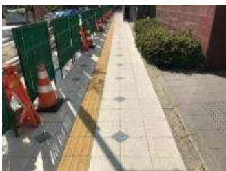
▲コンフォートホテル前