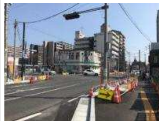
▲スクランブル交差点