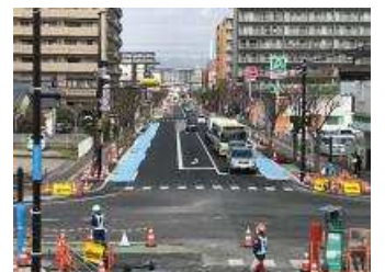
▲北口交差点と市道三溝線