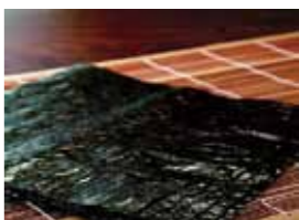
▲生産量・販売額ともに15年連続日本一が濃厚になった佐賀の海苔

例えば、放流水の成分を季節ごとに調整し、海苔養殖漁場に必要な栄養塩として供給するなど、地域貢献に努めています。