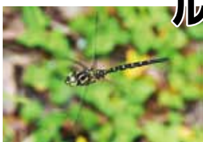
▲第28回県内撮影部門 最優秀賞 長谷川 裕二