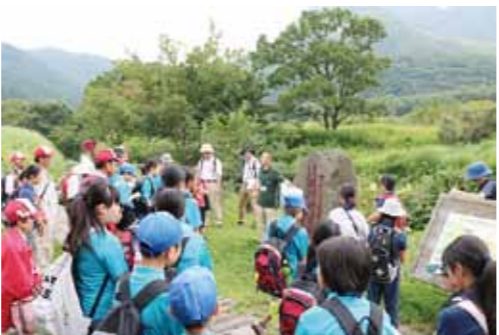
▲タデ原湿原(大分県九重町)での交流の様子