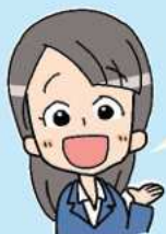
市役所職員の Sさん