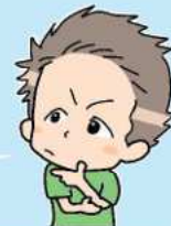
佐賀市で暮らす Tさん

必要な情報を知りたい時、どうしたらいいんだろう？ いろんな情報があるけど、わかりやすく伝えてもらえたらいいなあ。