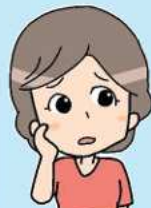
ボランティア団体の Aさん