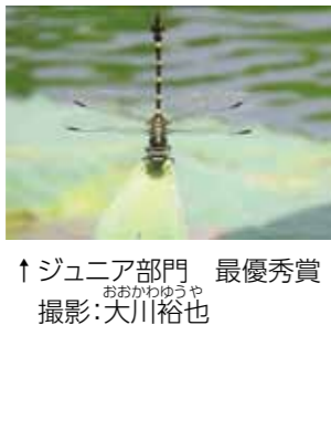
↑ジュニア部門 最優秀賞